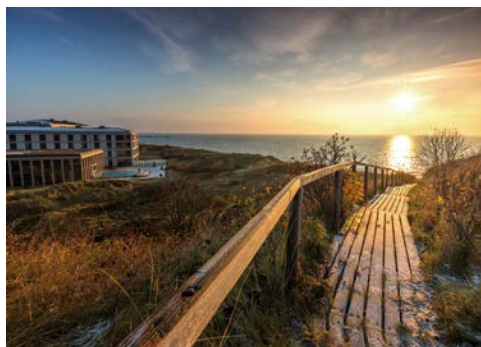
Superior A-ROSA Hotel Sylt

Taxi-Service (falls gebucht) zum ZOB Oldenburg, Transfer nach Bremen. Ihre bequeme Bahnreise beginnt mit dem 1. Klasse-Sonderzug AKE-RHEINGOLD vom Bremer Hauptbahnhof über den Hindenburgdamm bis nach Westerland. Anschließend erfolgt der Bus- und Gepäcktransfer nach List in das A-ROSA Hotel Sylt.