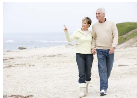
Herrlich – diese Luft!

Nach erholsamen Tagen treten Sie nach dem Frühstück die Heimreise an. Ein Bus bringt Sie an den Bahnhof nach Westerland. Von hier geht es mit dem 1. Klasse-Sonderzug AKE-RHEINGOLD zurück nach Bremen an. Anschließend Transfer nach Oldenburg und Taxi-Service (falls gebucht) nach Hause.