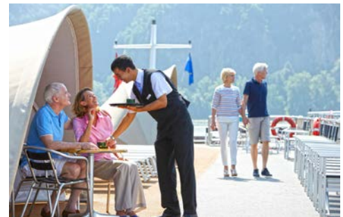
Herzlicher Service ...