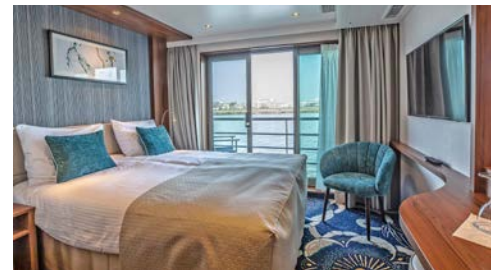
Komfortable Kabinen, z.B. auf dem Diamantdeck

Programmänderungen vorbehalten. An- und Abreisetag dienen ausschließlich der Erbringung der vertraglichen Beförderungsleistungen. Stand 04/21 – alle Angaben ohne Gewähr.