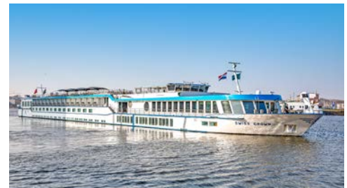
... an Bord der SWISS CROWN

Weitere buchungsrelevante Informationen zu dieser Reise (An- und Abreise, Gesundheitshinweise, Barrierefreiheit, eventuell anfallende Mehrkosten während der Reise etc.) erhalten Sie im Internet unter: leserreisen.nwzonline.de