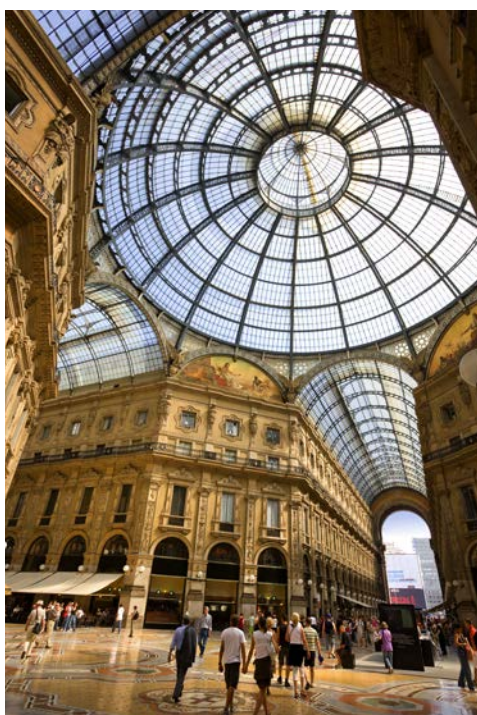
Galleria Vittorio Emanuele II in Mailand

Nach dem Frühstück erfolgt die Abfahrt in Richtung Mailand, der norditalienischen Wirtschafts- und Modemetropole. Hier finden Kunst, Kultur, Design und Kommerz eine lebendige und spannende Verbindung. Bei einem interessanten Rundgang mit der Reiseleitung erfahren Sie viel über die zahlreichen Sehenswürdigkeiten. Allen voran der Mailänder Dom, die Galleria Vittorio Emanuele II, die berühmte „Scala“ und das imposante Kastell der Familie Sforza. Nachmittags empfehlen wir einen individuellen Bummel entlang der vielen Modeläden in der Via Montenapoleone. Auch ein Besuch in einem der großen Kaufhäuser bietet einen besonderen Reiz, denn dort hat man die Möglichkeit, Mode und italienisches Design preiswert zu erwerben. Und zum Abschluss eines tollen Tages bietet es sich an, in einer der Bars in der Galleria Vittorio Emanuele II einen Aperol und Campari zu genießen. Danach geht es zum Abendessen und zur Übernachtung zurück ins Hotel.