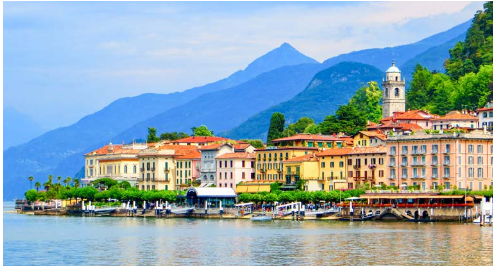
Auf der gegenüberliegenden Wasserseite von Cadenabbia: Bellagio

Die Schönheit und der ganz besondere Reiz der Landschaft verzaubern schon seit Jahrhunderten die Besucher. Künstler, Dichter und Denker wurden von der ganz besonderen Atmosphäre dieser Landschaft inspiriert. Die Seeufer sind gesäumt von zahlreichen schönen Villen, Parks und Gärten und aufgrund des milden Klimas wächst dort eine Vielfalt exotischer Pflanzen. Romantik, Spannung, Abenteuer, Erholung und wundervolle Panoramen warten auf Sie.