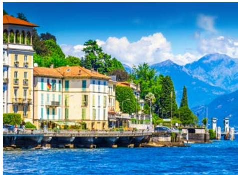
Bezaubernd – Ihr Urlaubsort Cadenabbia

Im Hotel angekommen beziehen Sie Ihre Zimmer und genießen einen Willkommensgetränk bevor es zum Abendessen im Hotel geht.