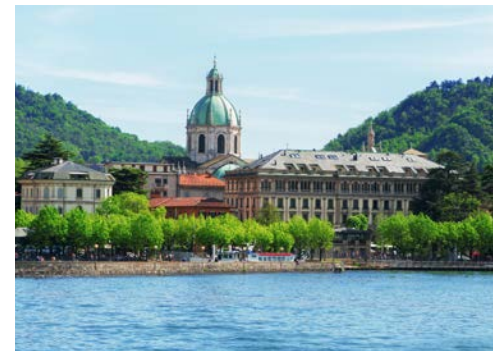
Unübersehbar – der Dom von Como

Stadtbild Comos wird von zahlreichen mittelalterlichen Baudenkmalern aus der Blütezeit der Stadt bestimmt. Vom Hafen Comos aus verkehren zahlreiche Schifffahrtlinien und öffentliche Busse, mit denen man den See und die Umgebung erkunden kann, außerdem noch die Drahtseilbahn von Como zum Monte di Brunate, von dem aus man ein wunderbares Panorama genießen kann. Anschließend Rückfahrt zum Hotel. Der Nachmittag steht für eigene Unternehmungen zur freien Verfügung. Abendessen und Übernachtung im Hotel.