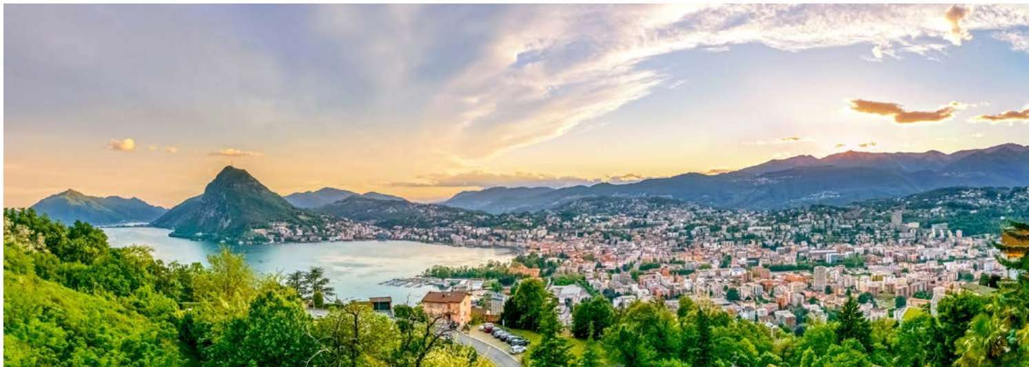
Der Luganer See (hier im Bild) und der Lago Maggiore buhlen mit dem Comer See darum, welcher See der schönste ist ... können Sie sich entscheiden?