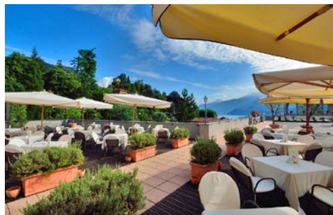
Hotel-Terrasse mit Blick über den See