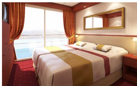
Kabinenbeispiel mit frz. Balkon

Das Leserreisen-Büro ist seit dem 12.10.2020 bis auf weiteres für den Publikumsverkehr geschlossen.