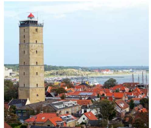
Der Leuchtturm „Brandaris“ in West-Terschelling

Erkunden Sie heute auf einer Rad-Rundtour Texel, die größte westfriesische Insel, mit abwechslungsreicher Landschaft und malerischen Dörfern. Tipp: Die gut ausgeschilderte Thijsseroute (ca. 40 km) mit Besuch der Seehundaufzuchtstation EcoMare.