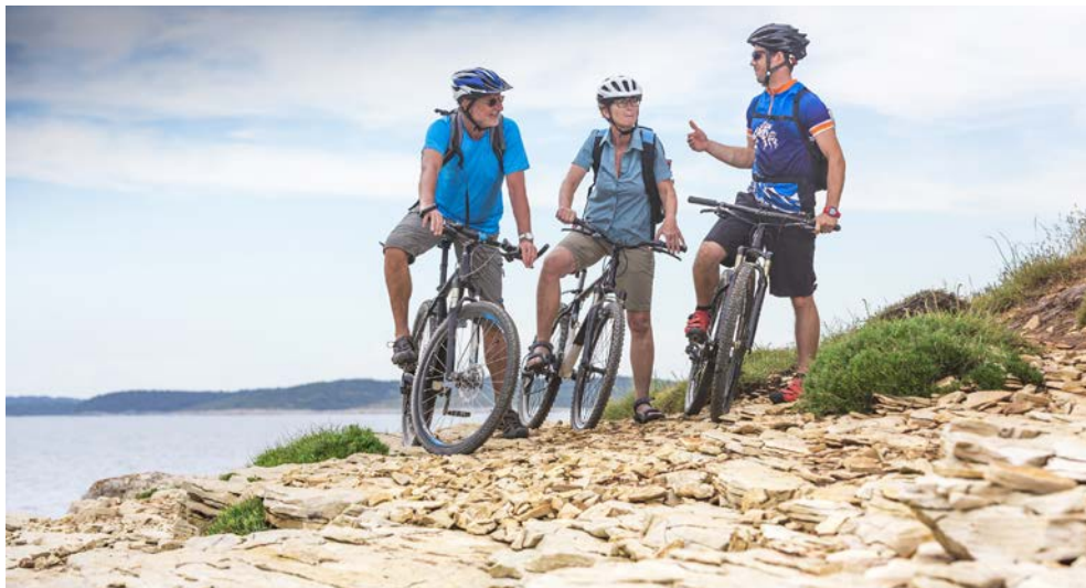
Freuen Sie sich auf schöne Fahrradtouren