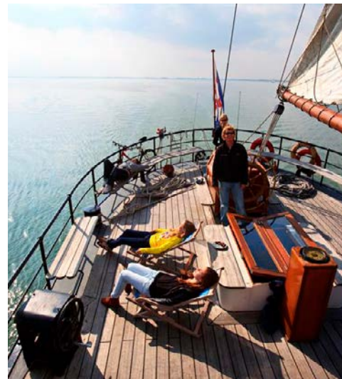
... und entspannen Sie an Bord

Dünen. Mit ein bisschen Glück sehen Sie jede Menge Enten, Stelzenläufer und große Kolonien von Löffelreiern und Mantelmöwen. Am späten Nachmittag segeln Sie nach Harlingen, dem wichtigsten Hafen Frieslands.