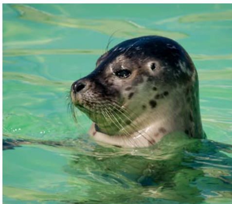
Besuchen Sie die Seehundaufzuchtstation Eco-Mare

Nach dem Frühstück erfolgt die Ausschiffung bis 9.30 Uhr und Ihre Heimreise wie gebucht.