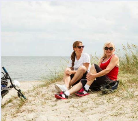
Erleben Sie Meer, Wind und Sonne