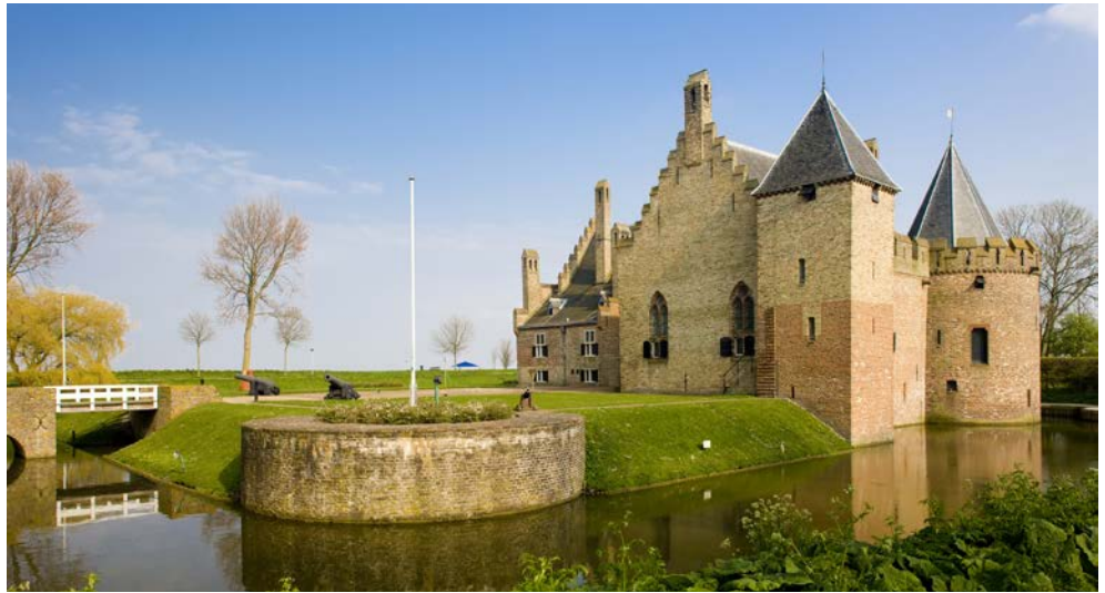
Traumhaft schön: Medemblik

Wind und Salz auf der Haut und ein Gefühl von Freiheit! Segelreisen sind etwas Besonderes. Es ist ein bisschen so, als ob man als Seefahrer-Pionier die Meere erkundet... Erleben Sie hautnah auf der WAPEN FAN FRYSLAN das IJsselmeer und das Wattenmeer. Natur und Elemente pur: Meer, Wind und Sonne. Vor der Nordseeküste erstreckt sich das Watt, ein Naturgebiet, das in der ganzen Welt einzigartig ist. Auf dem Festland der Provinzen Nord-Holland und Friesland erwarten Sie weite Landschaften, beschauliche Orte und malerische Fischerstädtchen. Freuen Sie sich auf eine steife Brise in den Segeln und einen endlosen Blick aufs Wasser, auf Dünen und trocken gefallene Sandbänke. Wenn Sie Lust haben, können Sie an Deck mit anpacken – erforderlich ist es nicht. Auch Segelerfahrung ist nicht nötig. Worauf warten Sie noch? Leinen los!