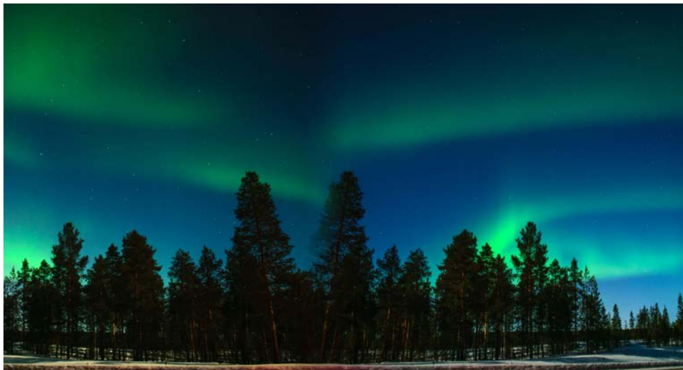
Was für ein Naturspektakel!