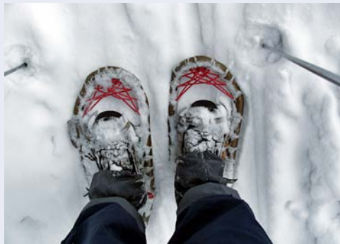
Unterwegs mit Schneeschuhen