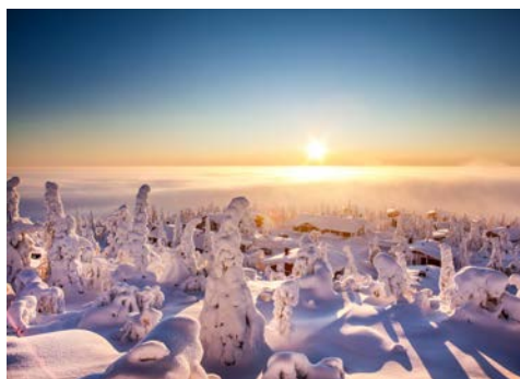
Willkommen in Lappland