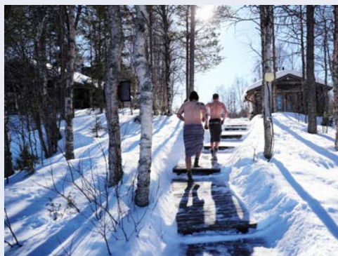
Wie wäre es mit einem Eisbad nach dem Saunabesuch?