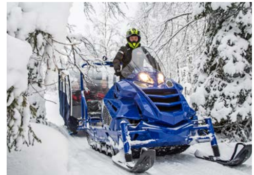
Abenteuer pur bei einer Motorschlittensafari

Ein zauberhafter Nachmittag erwartet Sie mit Ihrer Reiseleitung auf einer Rentierfarm. Hier erfahren Sie aus erster Hand Näheres über die Bedeutung der Tiere für die Menschen in der Region. Eine kleine Rentierschlittenfahrt beschließt Ihr heutigen Abenteuer. Wenn Sie mögen, lassen Sie den Tag mit einem Saunabesuch und anschließendem Eisbad im See ausklingen (körperliche Eignung vorausgesetzt).