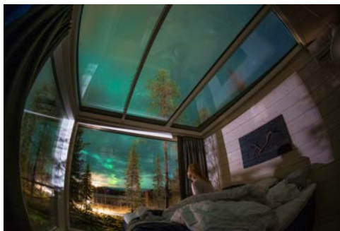
Magischer Zauber am Nachthimmel

(ca. 20 km entfernt von Ihrem Hotel). Um Ihnen die gewünschte Privatsphäre zu gewähren, ist jede Villa mit Vorhängen ausgestattet. So können Sie das gemütliche, aber moderne Innere der Villa genießen. Die Villas sind mit Doppelbett, einer Küchenzeile sowie ein Badezimmer mit WC und Dusche ausgestattet. Ein Lagerfeuerplatz in der Anlage der Villen ermöglicht es Ihnen das Outdoor-Leben für sich zu entdecken.