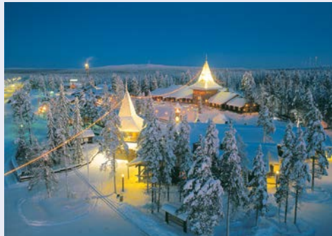
Das Weihnachtsmanndorf in Rovaniemi

Wer ein echtes Winterparadies entdecken möchte, kommt an dieser fantastischen Reise einfach nicht vorbei! Magisch schimmernde Schneelandschaften erwarten Sie im Winterwunderland Finnisch-Lapplands. Erleben Sie einen unvergesslichen Winterurlaub inmitten verschneiter Wälder, zugefrorener Seen und mit etwas Glück dem Zauber der geheimnisvollen, grünlich leuchtenden und tanzenden Polarlichter. Lernen Sie die Region und Traditionen bei einer Schneeschuhwanderung, Hundeschlittenfahrt und einer rasanten Fahrt mit dem Motorschlitten näher kennen und entspannen Sie im Anschluss in der typisch finnischen Sauna. Diese Reise wird zu einem unvergesslichen Erlebnis!