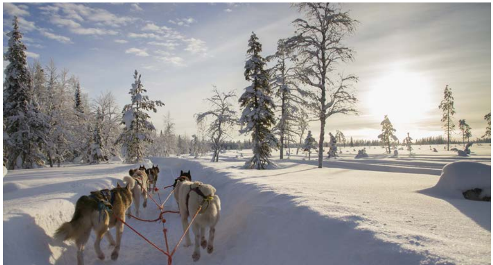
Die Huskys können es kaum erwarten, mit Ihnen Geschwindigkeit aufzunehmen