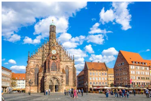
Nürnberg lohnt mehr als einen Blick

der mittelalterlichen Festung Marienberg beherrscht. Auf dem rechten Mainufer steht die fürstbischöfliche Residenz, eine der großartigsten Schlossbauten des Barocks und auf der UNESCO-Liste des Weltkulturerbes. Bei einem geführten Stadtrundgang lernen Sie die wichtigsten Sehenswürdigkeiten der alten Haupt- und Bischofsstadt Würzburg kennen, wie den Residenzplatz, den Dom, die Neumünsterkirche, das Haus zum Falken und das alte Rathaus. Danach bleibt sicher noch etwas Zeit für einen Bummel auf eigene Faust.