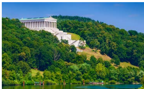
Walhalla bei Donaustauf

In der Nacht hat Ihr Schiff Regensburg erreicht. Nach dem Frühstück erwartet Sie ein geführter Rundgang durch die einstige Freie Reichsstadt. Regensburg wird durch ein mittelalterliches Stadtbild geprägt und ist gleichzeitig auch eine lebendige Metropole mit regem Kulturleben und leicht südländischem Flair. Ein Stadtführer wird Ihnen die wichtigsten Sehenswürdigkeiten, wie z. B. die Schottenkirche, den Haidplatz, das Alte Rathaus, die Steinerne Brücke und den Dom, zeigen. Danach besuchen Sie die Walhalla bei Donaustauf, die dem Parthenon-Tempel der Athener