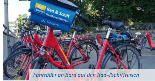
Fahrräder an Bord auf den Rad-/Schiffreisen