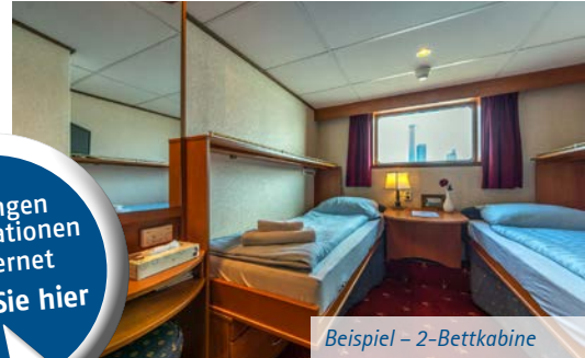
Beispiel – 2-Bettkabine