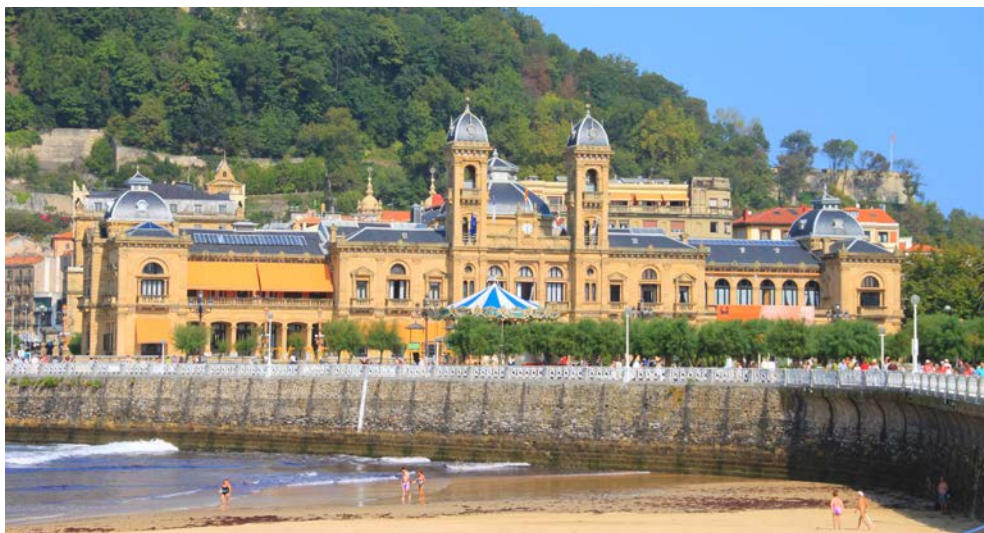
Das Rathaus in San Sebastian

zu sehen. Der Nachmittag steht Ihnen zur freien Verfügung.