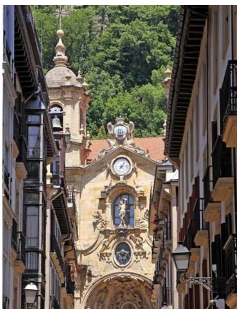
Die Basilika Santa Maria del Coro in

zu sehen. Der Nachmittag steht Ihnen zur freien Verfügung.