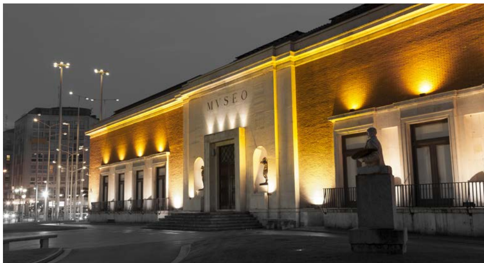
Das Museum der schönen Künste in Bilbao