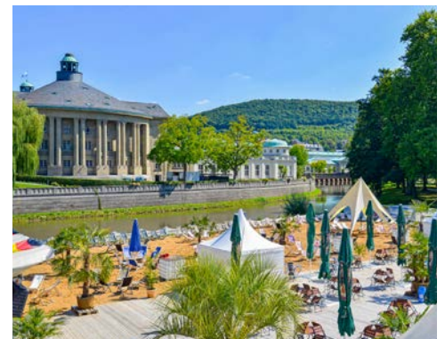
Der Stadtstrand an der Saale