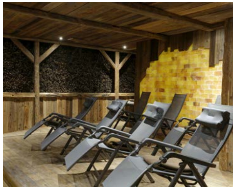
Erholen Sie sich in gemütlicher Atmosphäre

Dieses imposante Bauwerk sollten Sie nicht verpassen, zumal er hervorragend zu Fuß oder per Ausflugsschiff mit Abfahrt im Rosengarten zu erreichen ist. Im Volksmund heißt er „Saline“, wobei er nur ein Überbleibsel der ursprünglichen Salzgewinnungsanlagen (Salinen) darstellt. Die einstige Gesamtlänge von 2,2 km kann die Anlage nicht mehr vorweisen, was nach der Einstellung der Salzgewinnung auch nicht mehr nötig war. Als therapeutisches Element gewann der Gradierbau dagegen immer mehr an Bedeutung. Unternehmen Sie einen Wandelgang durch den Gradierbau und stellen Sie fest, wie wohltuend das bewusste Einatmen der reinen, salzhaltigen und gesunden Luft sein kann.