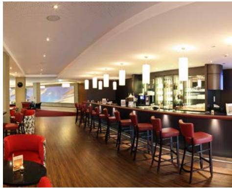
Genießen Sie ein Glas Wein in gemütlicher Atmosphäre

Mit dem CUP VITAL-Service-Taxi reisen Sie von Zuhause ins Hotel und zurück inklusive Kofferservice.