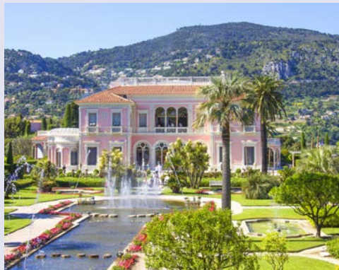
Die Villa Ephrussi de Rothschild