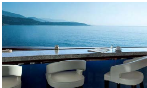
Blick von der Hotelterrasse