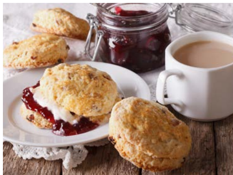
Scones mit Cream Tea – einfach lecker

Die Zimmer sind komfortabel und mit LCD-TV, Telefon, Klimaanlage sowie einem Kaffee-/Teezubereiter, Bad und Haartrockner ausgestattet.