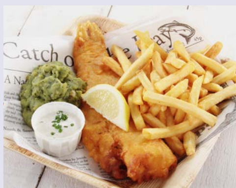
Fish & Chips - einfach lecker!