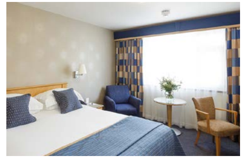
Zimmerbeispiel im Hotel