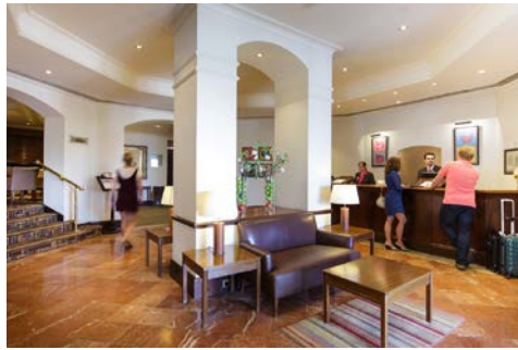
An der Rezeption