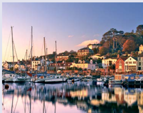
St. Aubin - wunderschön am Hafen gelegen