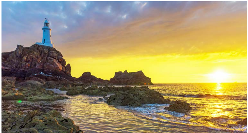
Leuchtturm La Corbière