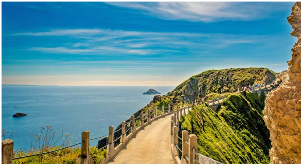
La Coupée – spektakulärer Übergang zwischen Sark und Little Sark

erbaut und ist mit Muscheln, bunten Porzellan-scherben und Kieselsteinen übersät. Nach der Fahrt durch Fort George, wo die Schönen und Reichen wohnen, erreichen Sie wieder St. Peter Port, wo die Fähre Sie zurück nach Jersey bringt.