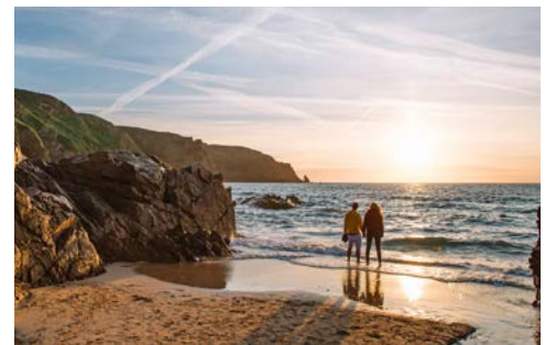
Inselauszeit auf Jersey

freien Verfügung. Empfehlenswert ist ein Besuch der Festungsanlage Elizabeth Castle, die Sie von St. Helier aus gezeitenabhängig bequem zu Fuß oder mit einem Amphibienfahrzeug erreichen können. Für Geschichtsinteressierte bietet sich der Zusatzausflug zu den War Tunnels an: In dieser mehrfach preisgekrönten Ausstellung wird die Besatzungszeit durch deutsche Truppen während des zweiten Weltkriegs mit Original-Möbiliar, Ton- und Bilddokumenten in bewegender Weise lebendig.