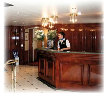
Willkommen an Bord!