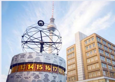
Weltzeituhr auf dem Alexanderplatz