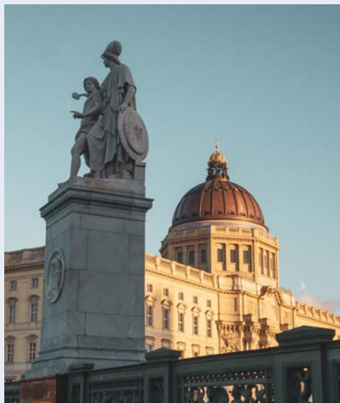
Berliner Schloss mit Humboldt Forum