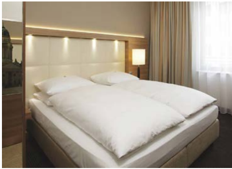
Zimmerbeispiel – H4 Hotel