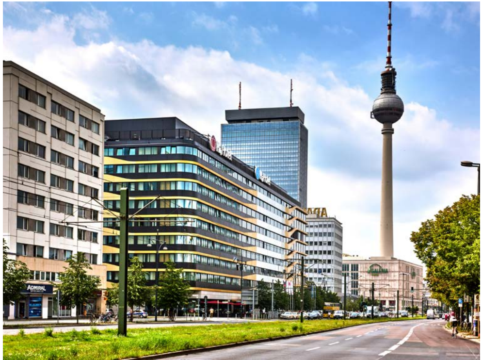
H4 Hotel Berlin Alexanderplatz