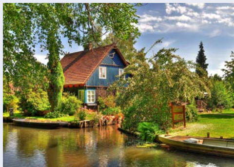
Ausflug in den Spreewald