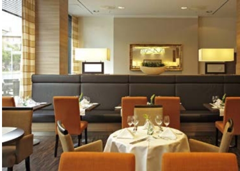
Restaurant – H4 Hotel