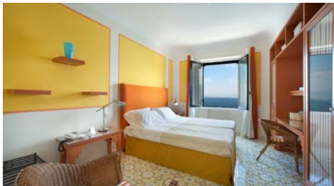
Zimmerbeispiel – Standard mit Meerblick

Von der Terrasse bietet sich ein grandioser Ausblick auf die umliegende Landschaft und das Meer. Im Restaurant kosten Sie exquisite regionale und internationale Gerichte.