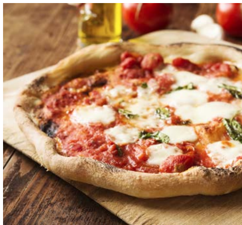
Ein Klassiker – Pizza Napoletana

Nachdem Sie in der Hauptstadt Kampaniens gelandet sind, erkunden Sie Neapel auf einem Stadtrundgang. Sie spazieren durch das monumentale Neapel – vorbei an dem berühmten Opernhaus Teatro San Carlo aus dem Jahre 1737, welches mit seinen 3.300 Plätzen jahrelang zu den größten und angesehensten Opernhäusern der Welt gehörte zur weitläufigen Piazza del Plebiscito. Im 19. Jahrhundert wurde sie für Aufmärsche und Feste genutzt, heute ist sie beliebte Flaniermeile. An deren Ende befindet sich der Palazzo Reale – der Königspalast aus dem 17. Jahrhundert. Danach werfen Sie noch einen Blick in die wunderschöne Einkaufspassage Galleria Umberto I. Sie wurde in den Jahren 1887-1890 erbaut und ist von einer großen Glaskuppel überdacht. In ihrem Inneren finden sich zahlreiche Mosaik- und Ornamente. Abschließend darf das berühmteste Gericht der Stadt nicht fehlen. Ende 2017 wurde die neapolitanische Pizza von der UNESCO zum Weltkulturerbe erklärt – Neapel gilt als Wiege der Pizza. Frisch gestärkt geht es nun zu Ihrem Hotel Minerva in Sorrent. Über der Stadt gelegen, bietet das komfortable Domizil einen herrlichen Blick auf den Golf von Neapel. Nach dem Begrüßungsgetränk wird Ihnen das Abendessen im Hotelrestaurant serviert.