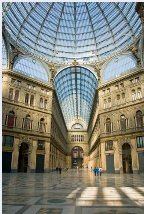
Passage Galleria Umberto I in Neapel

Das traditionsreiche Hotel Minerva aus dem Jahr 1878 öffnet seine Pforten über die Festtage! Der Ausblick von der Terrasse auf den Golf von Neapel und den Vesuv ist Balsam für unsere Seele in diesen turbulenten Zeiten!