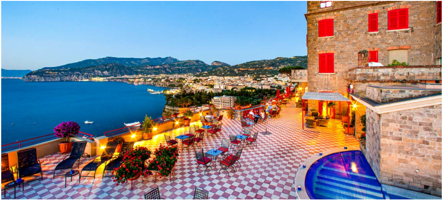
Das Hotel Minerva