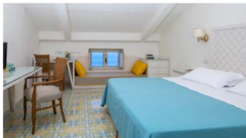
Zimmerbeispiel – Standard mit Meerblick

Genießen Sie von dem bereits 1875 erbauten Hotel Minerva die herrliche Aussicht über Sorrent und den Golf von Neapel. Die Altstadt von Sorrent erreichen Sie in fußläufiger Entfernung. Das Ambiente des in die Felsen auf verschiedenen Ebenen gebauten Hotels, besticht durch ein frisches, modernes Design in hellen und leuchtenden Farben. Alle 60 Zimmer sind geräumig und verfügen über eine kombinierte Heizung/Klimaanlage, Safe, Sat-TV, Minibar und ein eigenes Bad mit Haartrockner. Alle Zimmer haben Meerblick. Die Superior-Zimmer verfügen über einen eigenen Balkon.