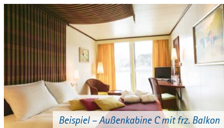
Beispiel – Außenkabine C mit frz. Balkon

fon, Haartrockner, Safe mit individuell einstellbarem Zahlencode, SAT-TV und einer individuell regulierba- ren Klimaanlage ausgestattet. Sie verfügen größtent- teils über einen französischen Balkon. Die Fenster können nur in der Kategorie 2-Bett-Außenkabine C mit französischem Balkon geöffnet werden. Die Schiffe verfügen in der Kategorie A über Kabinen mit einem Doppelbett und Zusatzbett.