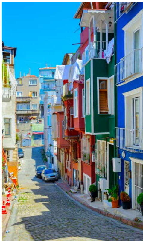
Auch das ist Istanbul – bunte Fassaden in der Altstadt

Alles Schöne hat mal ein Ende, so auch Ihre erlebnisreiche Reise nach Istanbul. Doch machen Sie sich nichts daraus, der nächste Urlaub kommt bestimmt. Hinzu kommt, dass Sie nun mit einem Koffer „voller neuer Erinnerungen“ zu Hause ankommen und sicher jede Menge zu erzählen haben. Transfer zum Flughafen und Abreise wie ausgeschrieben.