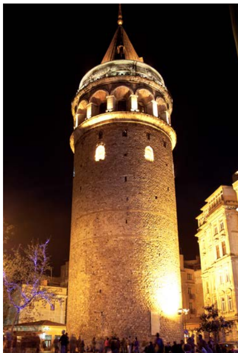
Der illuminierte Galataturm

Am Abend erleben Sie als unvergleichlichen Höhepunkt eine Silvestergala in einem Restaurant auf der Galatabrücke. Sie feiern den Jahreswechsel mit einem herrlichen Ausblick auf das Goldene Horn und den Bosphorus. Freuen Sie sich außerdem auf ein festliches Abendessen mit Musik! Wir wünschen Ihnen einen „Guten Rutsch“!