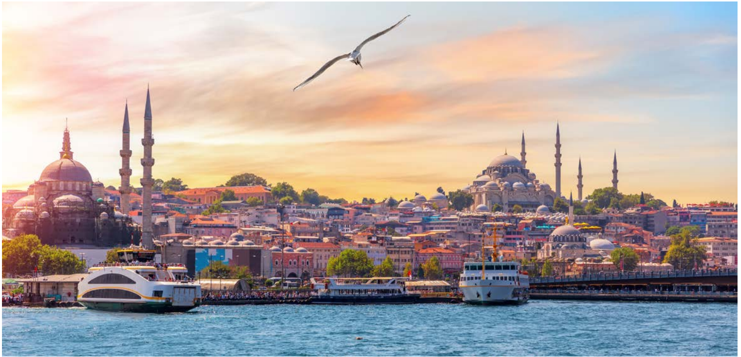
Blick auf den Galataturm am Goldenen Horn