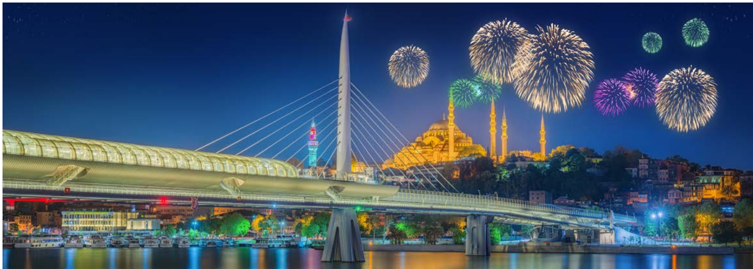
Ein fantastischer Anblick!