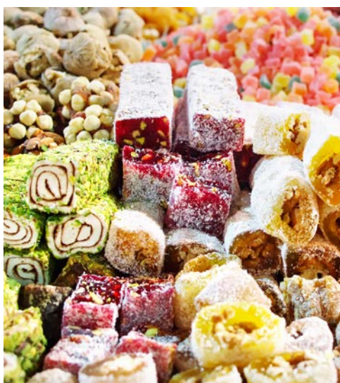
Leckereien auf dem Basar

teil. Zunächst fahren Sie über die Hängebrücke zur asiatischen Seite der Stadt. Vom Camlica Hügel aus hat man einen traumhaften Blick auf die ganze Stadt. Nach einem Spaziergang auf dem Markt von Üsküdar unternehmen Sie eine wunderschöne Schiffsfahrt auf dem Bosphorus. Hier werden Sie sich den Palastanlagen entlang zwischen den Kontinenten bewegen. Anschließend besuchen Sie die Hagia Sophia aus dem 6. Jhr., die zu den größten Kirchen der Welt zählt. In dieser Kirche befand sich, nach dem Glauben der Menschen, der Nabel der Welt.