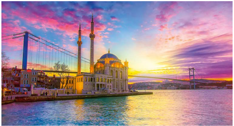
Ortaköy-Moschee am Bosphorus

„Yıl Basi“ (Kopf des Jahres) heißt der erste Tag im Jahr und wird in türkischen Familien oft ähnlich dem deutschen Weihnachtsfest gefeiert. Auch hier liegen Geschenke – diese kommen von Noel Baba – unter dem Baum, dem Neujahrs- oder Silvesterbaum. Und auch ohne ein zünftiges Feuerwerk geht zu Silvester nichts. Wenn man inmitten netter Menschen in den Himmel schaut und das neue Jahr mit einem Glas Sekt und vielen Umarmungen begrüßt, dürfen die bunten Lichter über den Dächern der großartigen Stadt nicht fehlen. Sie feiern in einem Restaurant auf der berühmten Galatabrücke und genießen dabei einen atemberaubenden Blick auf das Goldene Horn und den Bosphorus. In diesem Sinne wünschen wir Ihnen „Mutlu yıllar“ (Frohes Neues Jahr)!