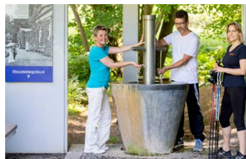
Gesundheitszentrum Helenenquelle - Willkommen!