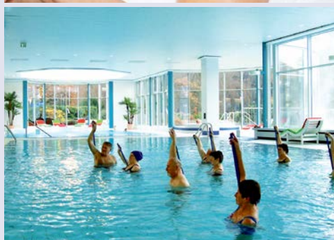
Tun Sie sich etwas Gutes