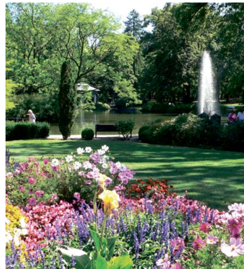
Unbedingt einen Spaziergang wert – der Kurpark

Majestätisch thront das Schloss Friedrichstein über der Stadt Bad Wildungen und ist auch schon von Weitem gut zu erkennen. Heute befindet sich hier ein Teil der Museumslandschaft Hessen-Kassel mit Sammlungen aus der hessischen Militär- und Jagdgeschichte. Kaffee und Kuchen können Sie im Schlosscafé genießen, welches in den Sommermonaten die Türen zur Terrasse des Südflügels öffnet und einen schönen Blick auf Bad Wildungen und die Umgebung frei gibt.