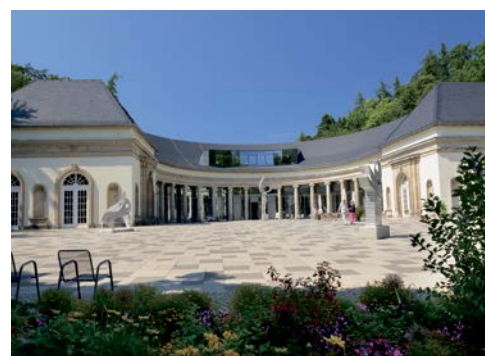
Die Wandelhalle im Kurpark