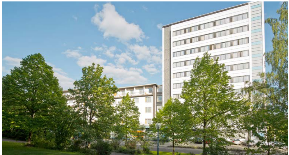
Ihre Anlaufstelle für Gesundheit und Entspannung – das Gesundheitszentrum Helenenquelle

Mit dem CUP VITAL Service-Taxi reisen Sie ganz bequem von Zuhause ins Gesundheitszentrum Helenenquelle und zurück – inklusive Kofferservice – sicher und schnell!