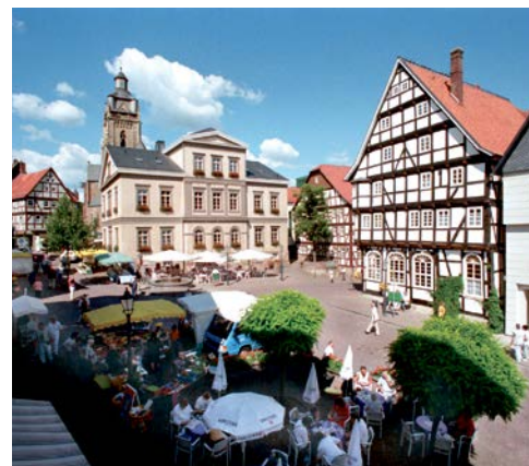
Marktplatz in Bad Wildungen