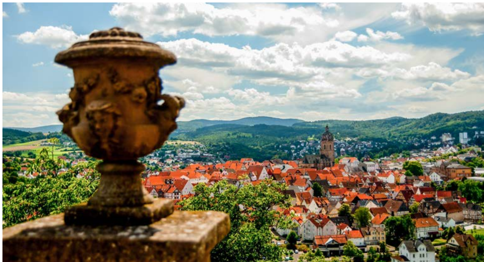
Blick auf Bad Wildungen von Schloss Friedrichstein...