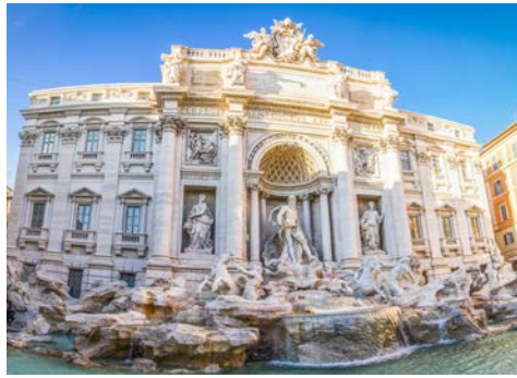
Der obligatorische Münzwurf am Trevibrunnen, ein Muss!

Am Vormittag können Sie die romantische Seite von Rom kennenlernen. Auf der breiten „Spanischen Treppe“ an der Piazza di Spagna herrscht stets Hochbetrieb. Wer Rom wiedersehen will, wirft eine Münze in die Fontana di Trevi, einen kunstvollen Barockbrunnen von Nicolo Salvi aus dem 18. Jh. Auf der Piazza Colonna sehen Sie die herrliche Säule des Marc Aurel, auf der Piazza di Pietra die Ruinen des Hadriantempels. Schließlich gelangen Sie zum besterhaltenen Bauwerk des antiken Roms, dem Pantheon, dessen Grundstein aus dem Jahre 27 n. Chr. datiert. Noch heute gilt der Kuppelbau als Musterbeispiel altrömischer Baukunst. Anschließend begeben Sie sich zur wunderschönen Piazza Navona mit der reich dekorierten Barockkirche Sant Agnese in Agone. Hier steht der berühmte Brunnen von Bernini „Fontana dei quattro Fiumi“, der die Flüsse Donau, Nil, Ganges und Rio de la Plata symbolisiert. Nutzen Sie den Nachmittag für einen entspannten Cappuccino in einem der zahlreichen Straßencafés oder lassen Sie sich durch das quirlige Rom treiben.