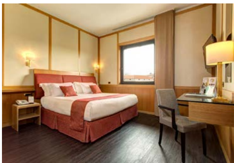
Zimmerbeispiel - Best Western Hotel

Das Haus wird regelmäßig renoviert und alle Zimmer sind mit kostenfreiem WLAN, Klimaanlage, Schalldämmung, Brandschutzanlage, Pay-TV, Sat-TV, Minibar, Safe und Wasserkocher ausgestattet. Außerdem bietet es Familienzimmer und einen großen Tagungsraum an.