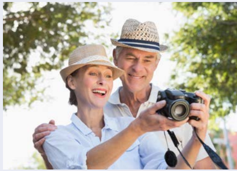
Unterwegs auf Entdeckungstour