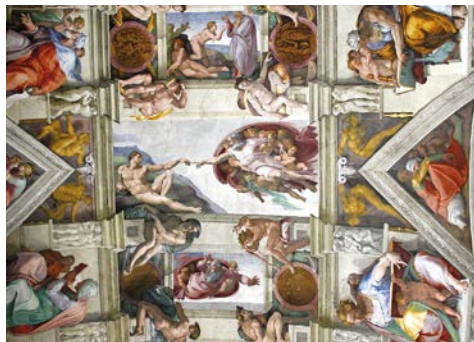
Sixtinische Kapelle – faszinierend

Der Vatikan, mit nur 0,44 km 2 der kleinste Staat der Welt, birgt Jahrhunderte alte Geschichte. Im Petersdom scheinen die unzähligen Figuren und Fresken ihre eigenen Geschichten zu erzählen und weisen auf so bedeutende Baumeister wie Bramante, Raffael und Michelangelo hin, die hier eines der wohl eindrucksvollsten Bauwerke der Welt geschaffen haben. Sie gelangen mit einem VIP-Ticket mit Vorreservierung der Einlasszeit in die Vatikanischen Museen, und von dort aus gelangen Sie in die Sixtinische Kapelle. Im Rahmen des Rundgangs haben Sie die Gelegenheit die zwischen 1508 und 1512 meisterhaft gefertigten Fresken von Michelangelo zu bestaunen. Sie zeigen die biblische Schöpfungsgeschichte, darunter auch das berühmte Werk „Die Erschaffung Adams“. In der Peterskirche, der größten Basilika der