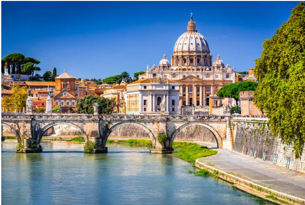
Die Engelsbrücke in Rom

Das Best Western Hotel President (Landeskategorie: 4 Sterne) steht für Klasse, moderne architektonische Linienführung und Funktionalität und ist das ideale Hotel für einen Aufenthalt in Rom: nahe dem Bahnhof „Roma Termini“ und im Herzen des historischen Zentrums. Die Basilika San Giovanni in Lateran, das Kolosseum, San Clemente und die Domus Aurea lassen sich zu Fuß erreichen. Die Metrohaltestelle (Linie A) „Manzoni“ befindet sich direkt vor dem Hotel. 187 Großzügig und geschmackvoll eingerichtete Zimmer mit einem qualitativ hochwertigem und effizientem Service, sowie eine gepflegte Gastronomie liegen der Hoteldirektion besonders am Herzen.