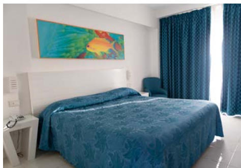
Zimmerbeispiel - Hotel Miramare

Morgens ist ein reichhaltiges Frühstück serviert und zum Abendessen gibt es typische Gerichte der mediterranen Küche.