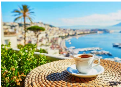
Genießen Sie „la dolce vita“

einen Ausflug nach Amalfi nicht entgehen lassen: Dabei fahren Sie über eine der schönsten Küstenstraßen der Welt. Sie schlängelt sich über Positano nach Amalfi an steilen Felswänden entlang und gewährt immer wieder wunderbare Aussichten auf das tiefblaue Meer. Amalfi verzaubert mit seinen schmalen Gässchen und Straßencafés. Zu den Hauptattraktionen gehören der Dom, der Campanile und der „Paradies-Kreuzgang“, diese können Sie während Ihrer Freizeit „auf eigene Faust“ erkunden.