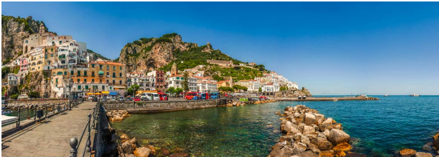
Zauberhafte Ausblicke auf Amalfi