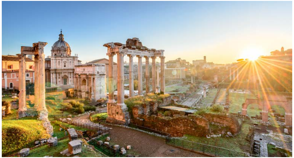
Forum Romanum in Rom

„La Dolce Vita“ – schon Johann Wolfgang von Goethe wusste seit seiner Italienreise im Jahr 1786 die italienische Lebensart, das milde Klima und die Kunstschätze Roms zu schätzen. Entdecken Sie die „ewige Stadt“ und ihre 3.000-jährige Geschichte und lassen Sie sich von der Fülle an Sehenswürdigkeiten verzaubern: Petersdom, Vatikan mit Sixtinischer Kapelle, Forum Romanum, Kolosseum... Im zweiten Teil Ihrer Reise erkunden Sie die antike Stadt Pompeji, kosten von dem leckeren Limoncello, dem „Nationalgetränk“ der Region Kampanien, und entdecken die malerische Region rund um Sorrent. Auf einem optionalen Ausflug können Sie außerdem die Schönheit der weltbekannten Amalfiküste hautnah erleben.