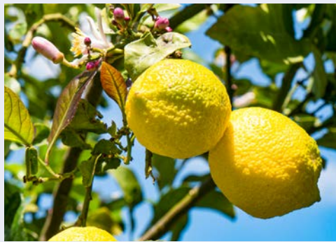
Willkommen auf Zypern