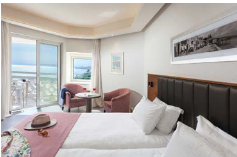
Beispiel – Standard Zimmer mit seitlichem Meerblick