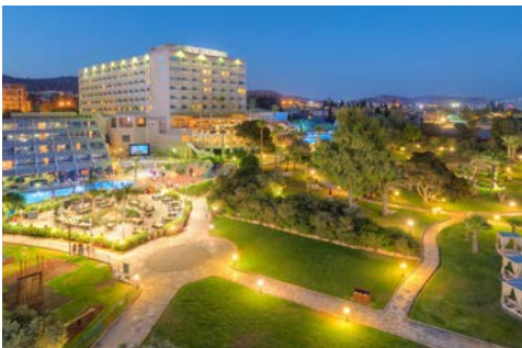
Hotel St. Raphael Resort & Marina

Unmittelbar am feinen Sandstrand gelegen, erfüllt die erst im vergangenen Jahr komplett renovierte Anlage all Ihre Träume. Sämtliche Zimmer verfügen über Balkon oder Terrasse. Zu den Mahlzeiten stehen auf der weitläufigen Anlage mehrere Restaurants zur Auswahl, überdies finden sich auf dem Gelände einige Bars und ein Lobby-Café. Neben zwei Frischwasser-Außenpools lädt ein Spa mit Sauna zum Entspannen ein. Daneben verfügt das Hotel auch über zwei Tennisplätze.