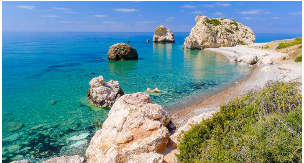
Felsen der Aphrodite

Hier machen die Götter Urlaub! Schon in der griechischen Mythologie wurde die paradiesische Mittelmeerinsel gepriesen. Zypern – das ist südländische Lebensart und eine Sagenwelt voller Mythen und Legenden. Die spannende Historie dieser Insel, die seit 1974 in den türkisch besetzten Teil und die Republik Zypern geteilt ist, lässt sich auf dieser Reise nachvollziehen. Ob antike Zeugnisse der römischen Besatzung, mystische Klöster, die eindrucksvollen Bäder der Aphrodite, lokale Weinanbauregionen, die im türkisch besetzten Teil liegende Stadt Famagusta oder die pulsierende Hauptstadt Nikosia – auf dieser Reise lernen Sie nicht nur die Vielfalt der zyprischen Kultur kennen, sondern auch und vor allem das Leben und die Menschen auf dieser einzigartigen Insel.