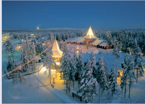
Das Weihnachtsmanndorf in Rovaniemi

Wer ein echtes Winterparadies entdecken möchte, kommt an dieser fantastischen Reise einfach nicht vorbei! Magisch schimmernde Schneelandschaften erwarten Sie im Winterwunderland Finnisch-Laplands. Erleben Sie einen unvergesslichen Winterurlaub inmitten verschneiter Wälder, zugefrorener Seen und mit etwas Glück dem Zauber der geheimnisvollen, grünlich leuchtenden und tanzenden Polarlichter. Lernen Sie die Region und Traditionen bei einer Schneeschuhwanderung, Hundeschlittenfahrt und einer rasanten Fahrt mit dem Motorschlitten näher kennen und entspannen Sie im Anschluss in der typisch finnischen Sauna. Diese Reise wird zu einem unvergesslichen Erlebnis!