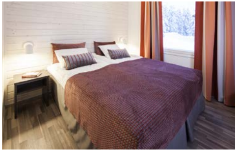
Zimmerbeispiel (ca. 18 m 2 )

Wellnessanwendungen sind ebenfalls kostenpflichtig buchbar. Wer sportlich aktiv sein möchte, kann sich ein Fatbike oder Schneeschuhe gegen Gebühr ausleihen. Für Kinder stehen kostenfrei kleine Schlitten im Winter zur Verfügung. Ein kleiner externer Skiverleih befindet sich in unmittelbarer Nähe.