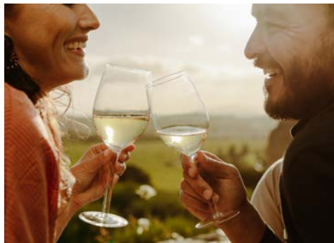
Genießen Sie Ihre Zeit in Rüdesheim

Direkt in einer Moselschleife gelegen besticht Traben Trarbach mit einem wunderschönen Panorama. Über der Stadt thronen die Mauern der 1350 erbauten Grevenburg von der nach 1734 nur noch Ruinen übrig geblieben sind. Ihre Weiterfahrt führt Sie nach Bernkastel-Kues, ein wahres Kleinod an der Mosel. Klein und fein, trägt der Ort trotzdem einen so großen Beinamen wie „Internationale Stadt der Rebe und des Weines“. Nutzen Sie die Gelegenheit und probieren Sie hervorragende Weine direkt vor Ort beim Winzer! Sie finden hier auch ein Weinemuseum. Doch Bernkastel hat noch mehr zu bieten: Sie besuchen eine Stadt, in der schon die Römer ihre Spuren hinterließen. Schlendern Sie über den wunderschönen Marktplatz, vorbei an stolzen Fachwerk-Häusern, und besichtigen Sie das Geburtshaus von Nikolaus von Kues.