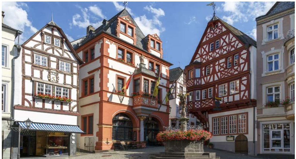
Marktplatz von Bernkastel-Kues