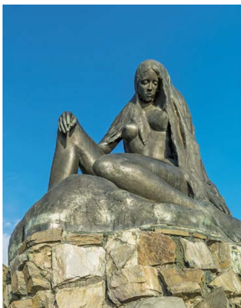
Lassen Sie sich von der Loreley betören

Heute endet Ihre erlebnisreiche Flussreise auf Rhein und Mosel. Ausschiffung nach dem Frühstück.