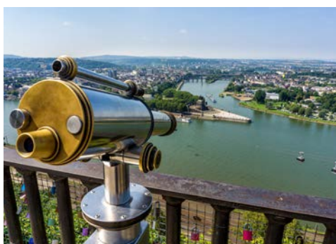
Die Basilika St. Kastor in Koblenz

Koblenz gehört zu den ältesten Städten Deutschlands. Lernen Sie die Zeugnisse der über 2.000-jährigen Geschichte der Stadt kennen. Entdecken Sie Schlösser, ehemalige Adelshöfe und herrschaftliche Bürgerhäuser, enge Gassen und romantische Winkel.