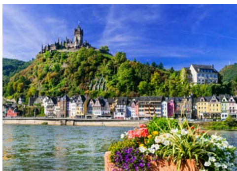
Die Reichsburg thront oberhalb von Cochem

Erleben Sie die unvergleichliche Mosel-Atmosphäre zunächst noch einmal in Bernkastel-Kues – vielleicht bei einem Spaziergang entlang des weitläufigen Moselufers. Anschließend bringt Sie Ihr Schiff weiter nach Cochem, ein verträumtes Städtchen mit verwinkelten Gassen und liebevoll restaurierten Fachwerkhäusern. Lohnenswert ist ein gemütlicher Spaziergang durch das viel besuchte Weinstädtchen. Die zahlreichen gut erhaltenen Reste der historischen Stadtmauer mit ihren alten Befestigungswerken zeugen noch heute von der belebten Vergangenheit.