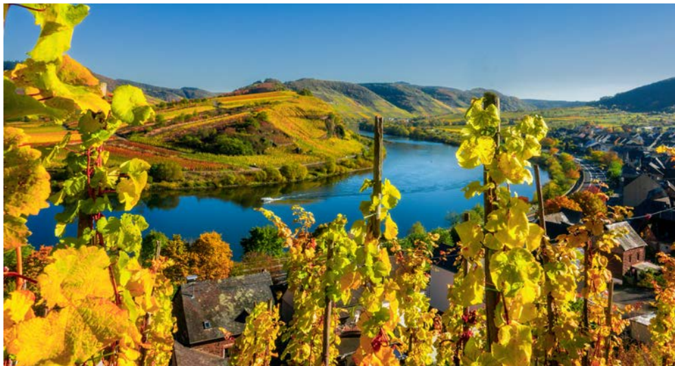
Mosel in goldenem Licht