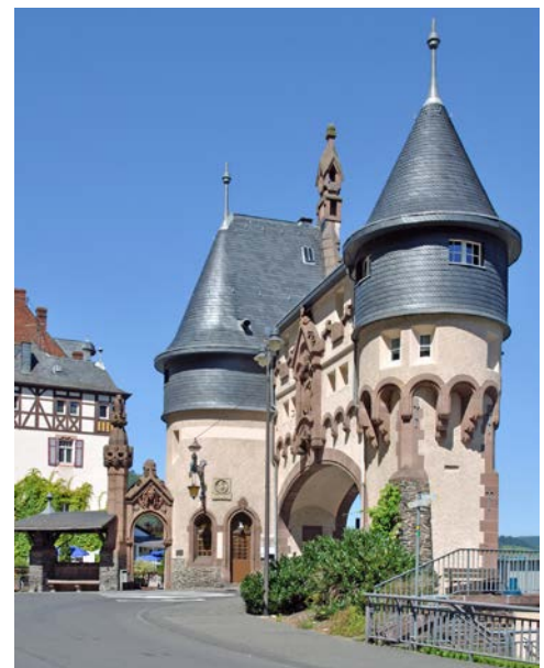
Brückentor in Traben Trarbach

Sie verlassen Rüdesheim und nehmen Kurs auf Alken. Damit haben Sie die liebliche Mosel erreicht, die sich kurvenreich und sanft von Weinörtchen zu