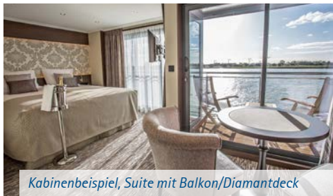
Kabinenbeispiel, Suite mit Balkon/Diamantdeck