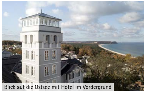
Blick auf die Ostsee mit Hotel im Vordergrund

Vielleicht Deutschlands schönste Insel mit den herrlichen Sandstränden. An der Küste über 100 Meter abfallende Kreidefelsen. Mit traumhaften alten Alleen. Mit Fichtenwäldern und Mischwald. Mit vielen charmanten Seebädern. Mit Naturschutzgebieten und Nationalparks. Mit Schlössern, Schlossparks, alten Gütern und reetgedeckten Fischerdörfern. Mit Bodden, Buchten, Nehrungen. Rügen ist ein Traum. Genießen Sie den Aufenthalt auf der größten Insel Deutschlands mit ihrer einzigartigen landschaftlichen Schönheit. Sie wohnen im traumhaften Vju Hotel in Göhren.